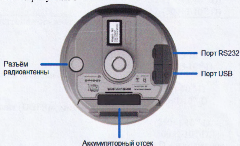
Рисунок 2 - Общий вид аппаратуры со стороны нижней части корпуса

В процессе эксплуатации, аппаратура не предусматривает механических и электронных внешних регулировок. Пломбирование аппаратуры не предусмотрено, ограничение доступа к узлам обеспечено конструкцией крепёжных винтов, снятие которых возможно только при наличии специальных ключей.