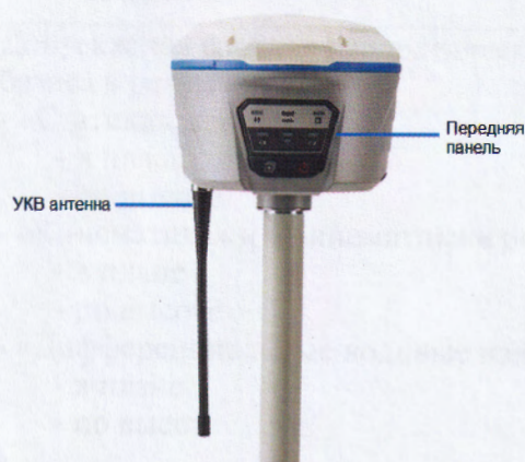
Рисунок 1 - Общий вид аппаратуры со стороны лицевой панели

Общий вид аппаратуры представлен на рисунках 1 - 2.